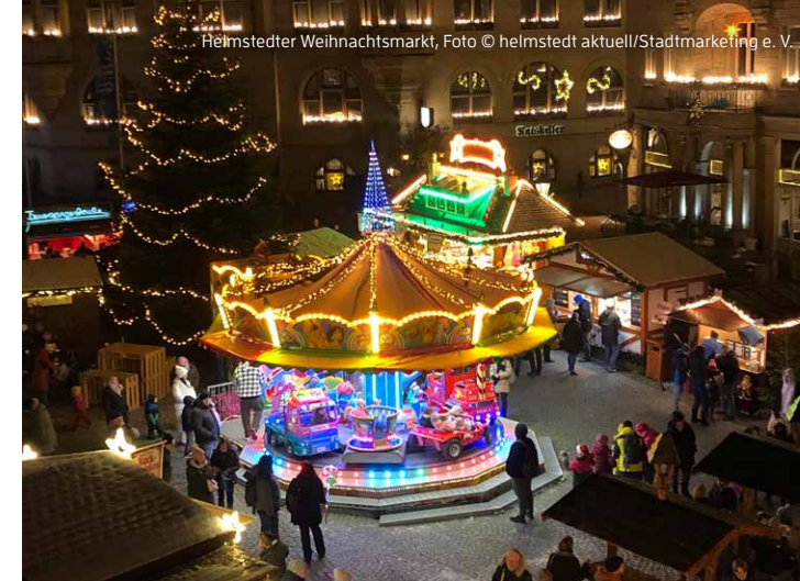
Helmstedter Weihnachtsmarkt

30.II. & 01.II.: Schlossmarkt zum Advent, Schloss Gifhorn | 30.II. & 01.II.: Wintermarkt im OTTER-ZENTRUM, Hankensbüttel | 01.II.: Müdener Weihnachtsmarkt, historische Ortsmitte, Müden (Aller) | 30.II. - 01.II., 07. - 08.II., 14. - 15.II. & 21. - 22.II.: Mühlenweihnacht auf dem Dorfplatz, Mühlenmuseum in Gifhorn