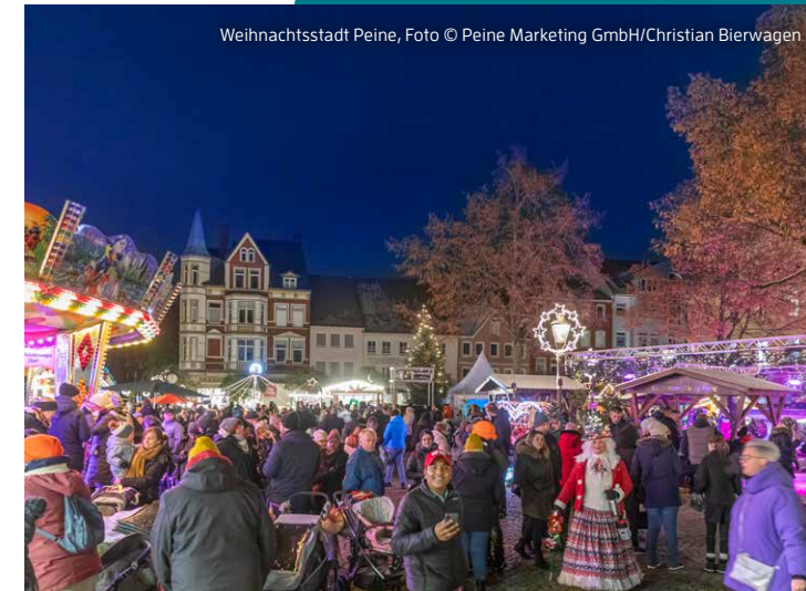
Weihnachtsstadt Peine