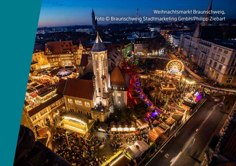
Weihnachtsmarkt Braunschweig