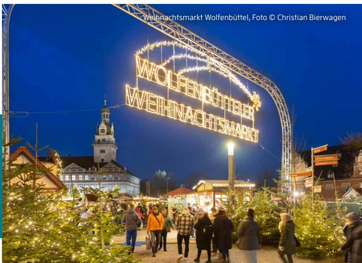
Weihnachtsmarkt Wolfenbüttel, Foto © Christian Bierwagen

27.II.-30.II.: Weihnachtsmarkt und Weihnachtswald, historische Altstadt Goslar (täglich 11 bis 20 Uhr, Weihnachtswald bis 22 Uhr) | 16. & 17.II.: „Weihnächtlicher Rammelsberg“, Weltkulturerbe Rammelsberg Goslar