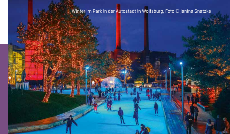
Winter im Park in der Autostadt in Wolfsburg

Alle Informationen zu den Attraktionen und Zeitepochen gibt es unter www.zeitORTE.de